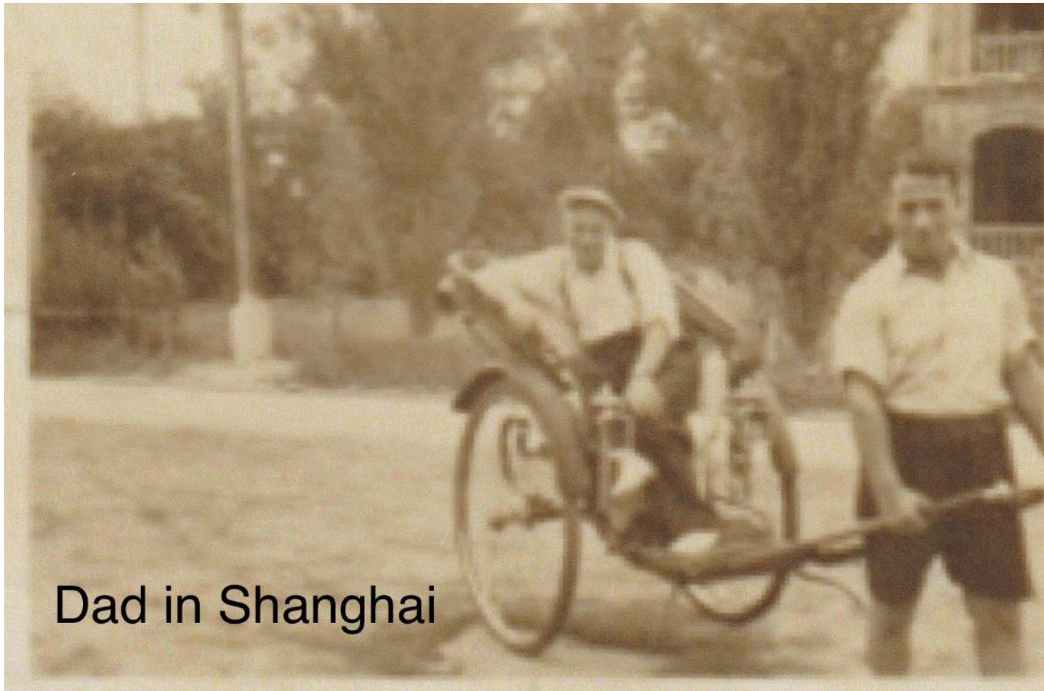
Dad in Shanghai