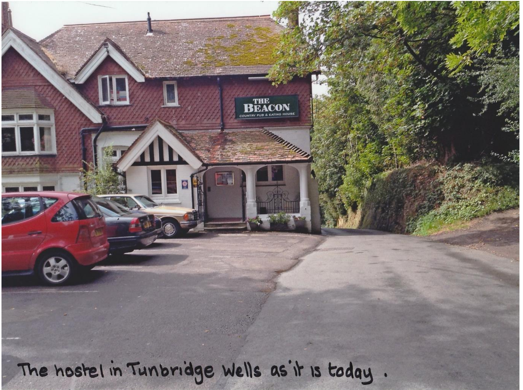
The hostel in Tunbridge Wells as it is today .