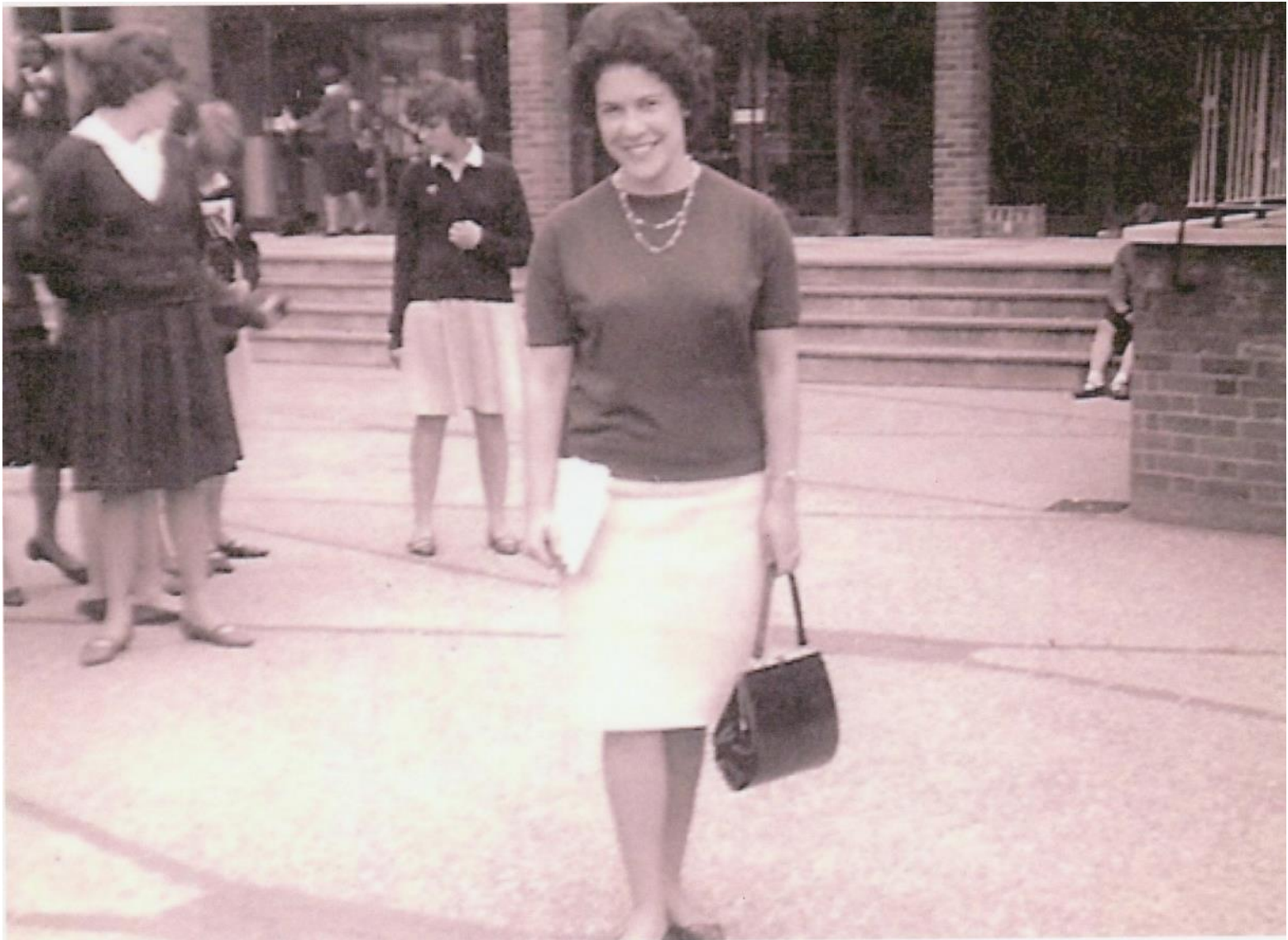
Me as a young teacher at Hammersmith County High School, (Shepherds Bush, London).